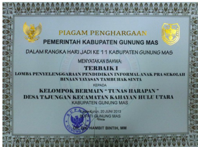
Sertifikat Penghargaan dari Pemda Gumas untuk Kelompok Bermain Tunas Harapan

Kepala Desa Tumbang Tajungan, Kecamatan Kahayan Hulu Utara ataupun yang mewakilinya tidak hadir di acara tersebut. YTS maupun pihak kecamatan tidak mengetahui sebabnya.