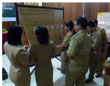
Peserta mengisi lembar evaluasi kegiatan