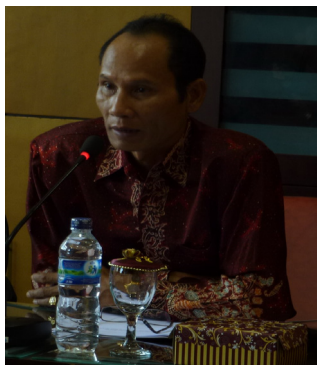
Wakil Bupati Gumas menyampaikan penghargaan atas kemajuan proyek Governance