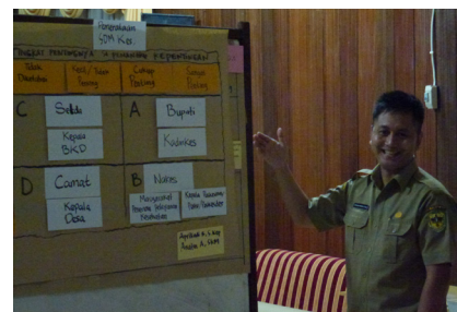
Bapak Ringkai mempresentasikan analisa stakeholder kelompoknya