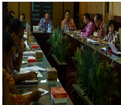
Kepala Bappeda memberikan pengantar pada kegiatan FGD SKPD dengan narasumber Koord. Proyek Governance