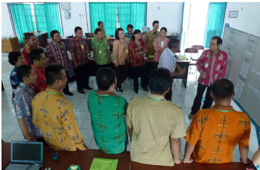
Fasilitator membahas hasil presentasi bersama peserta lainnya

Kegiatan ini dilaksanakan pada tanggal 3-4 April 2013 di Aula Bappeda. Pada hari pertama peserta hadir 100% (30 orang) dan pada hari kedua hanya sekitar 80% (25 orang) karena ada kegiatan Forum Gabungan SKPD di provinsi.